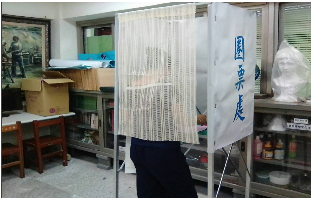
說明：模擬投票情形