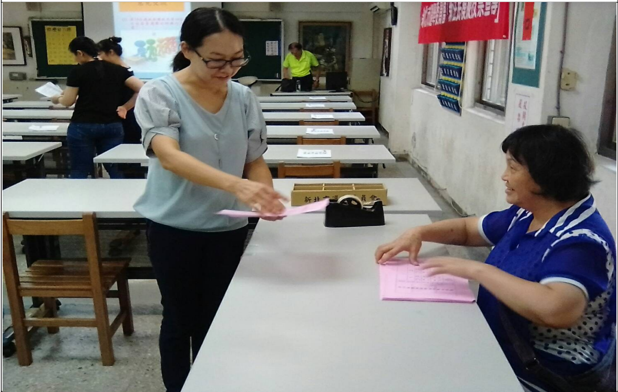
說明：模擬投票情形