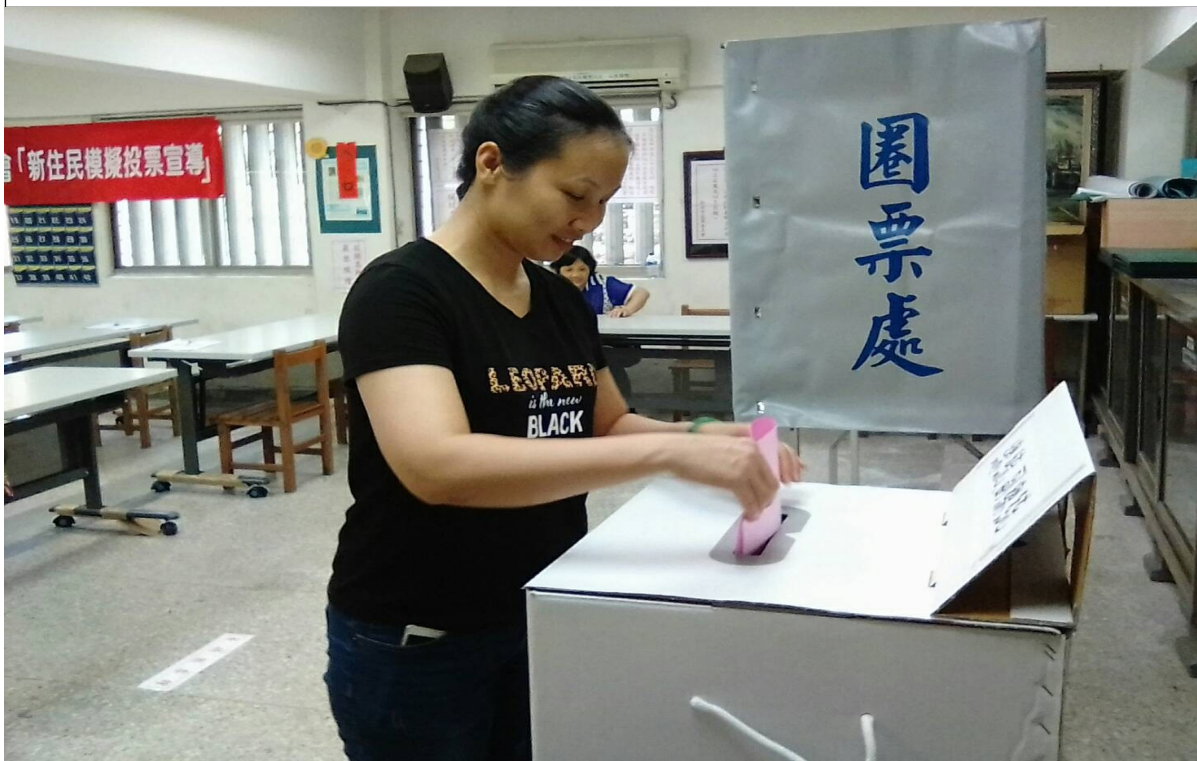
說明：模擬投票情形