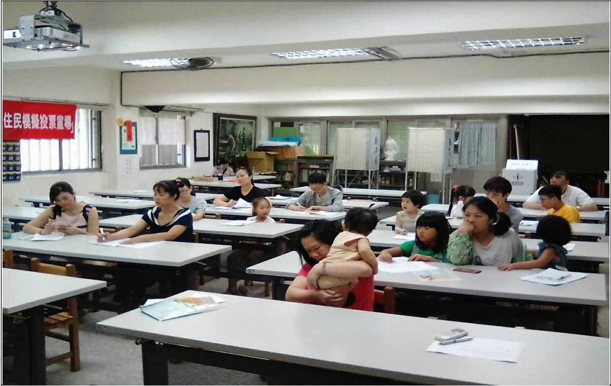
說明：學員上課情形