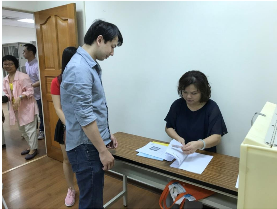
(四) 說明：模擬投票演練，領取選舉票