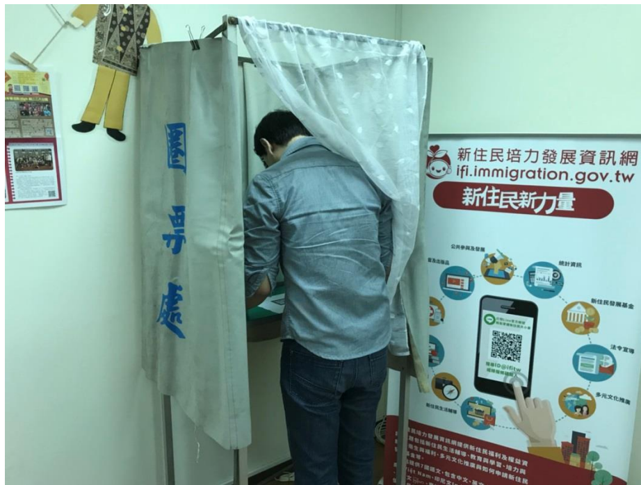
(五) 說明：模擬投票演練，使用圈選工具圈蓋選舉票