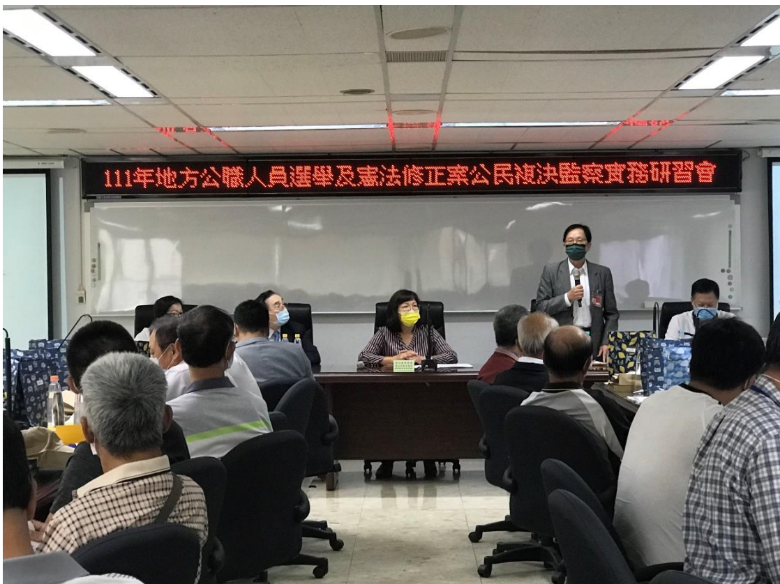
111 年地方公職人員選舉及憲法修正案公民複決監察實務研習會 中央選舉委員會邱委員昌嶽致詞