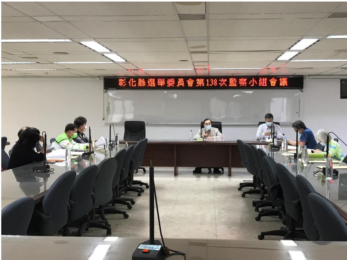
第 138 次監察小組會議