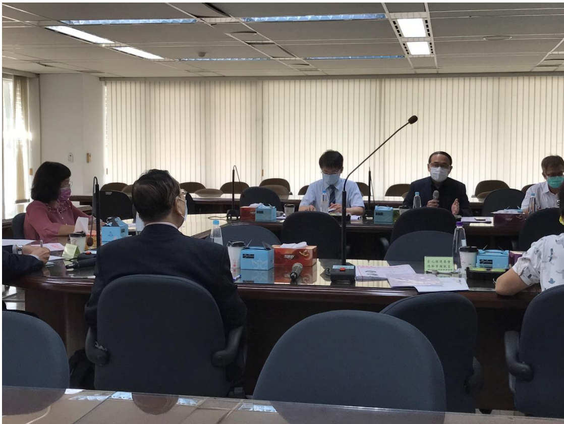
選、監、檢、警聯繫會議(111年11月10日)