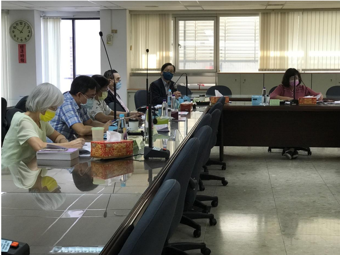
選、監、檢、警聯繫會議(111年11月10日) 中央選舉委員會邱委員昌嶽蒞臨指導