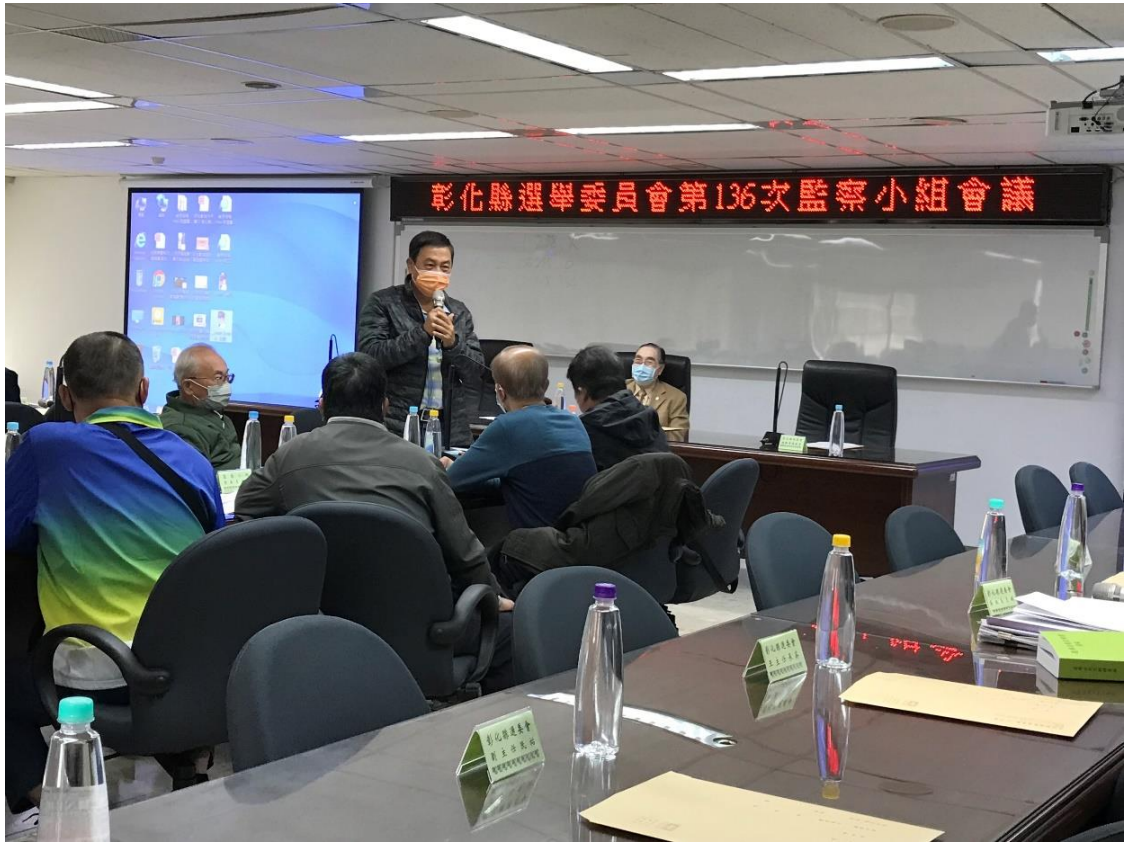
第 136 次監察小組會議