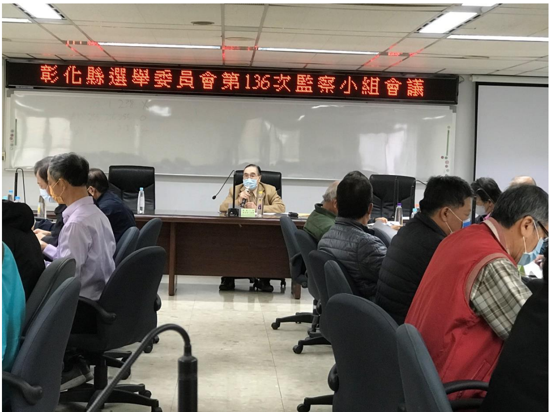
第 136 次監察小組會議