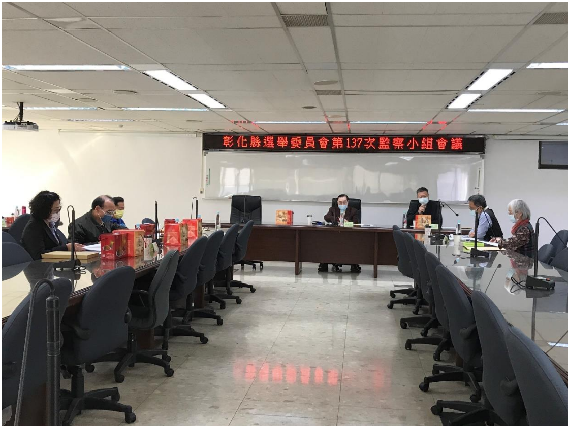
第 137 次監察小組會議