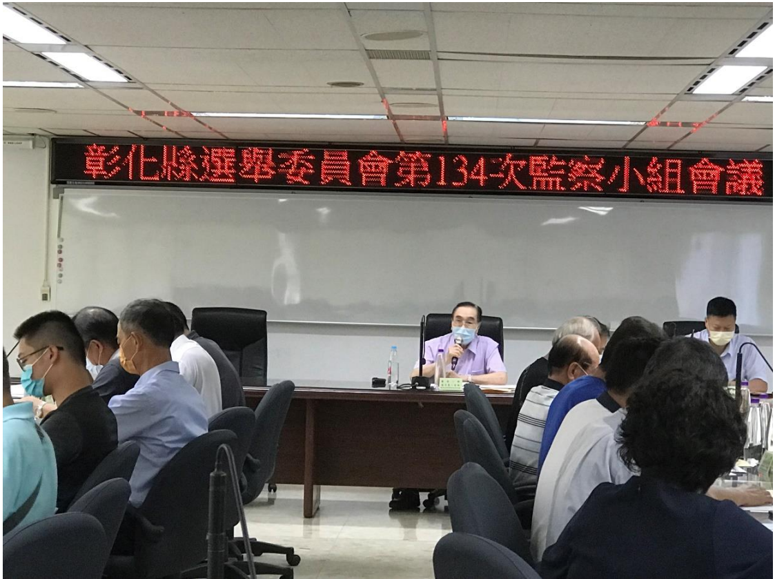
第 134 次監察小組會議