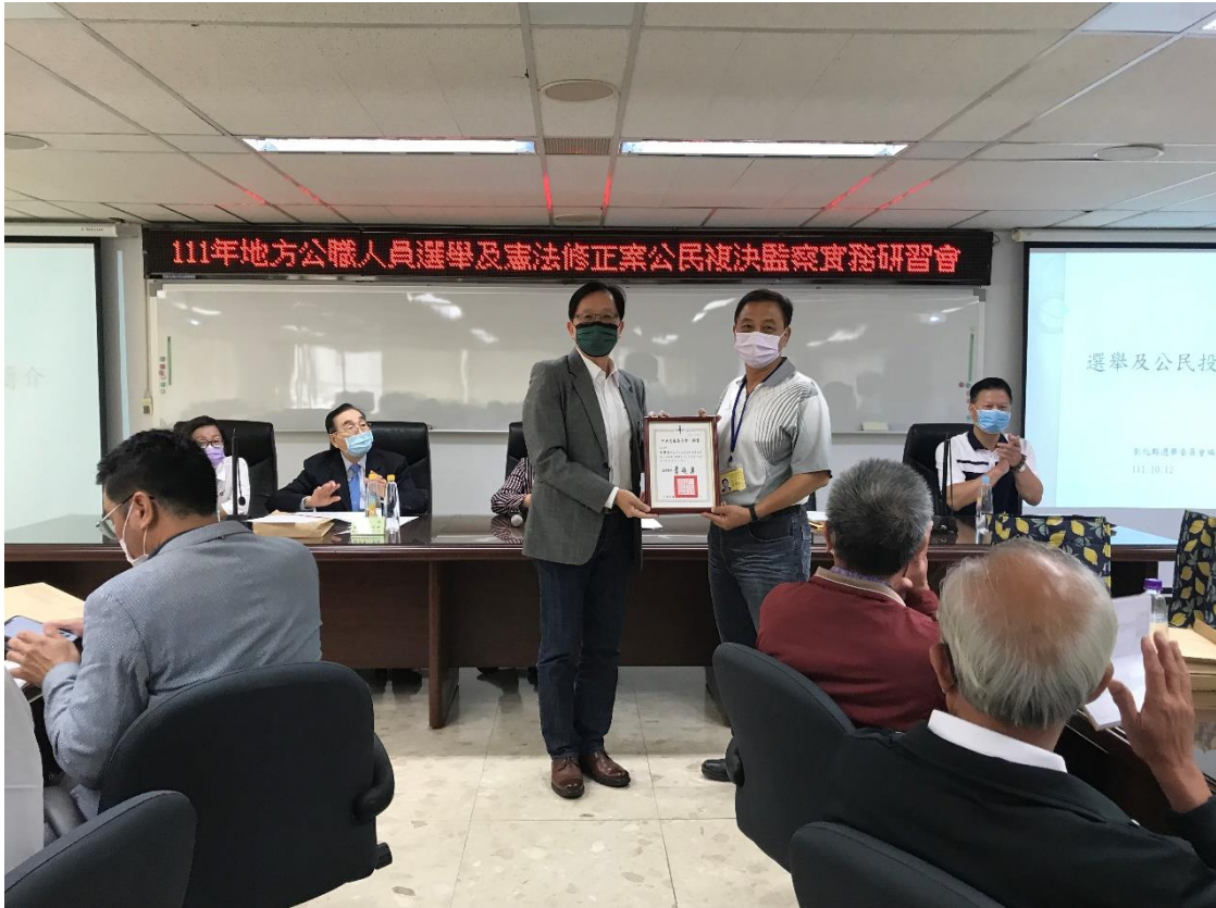
頒發監察小組委員聘書