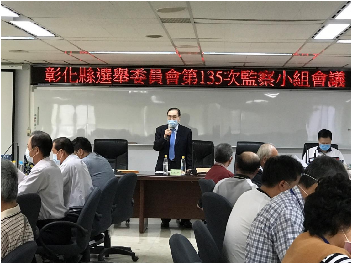
第 135 次監察小組會議