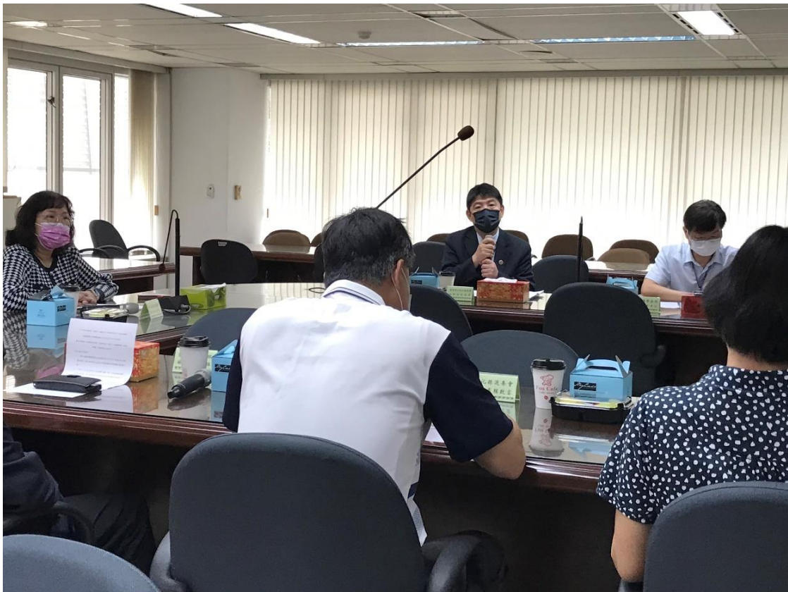
選、監、檢、警主管聯繫會報(111年11月23日)