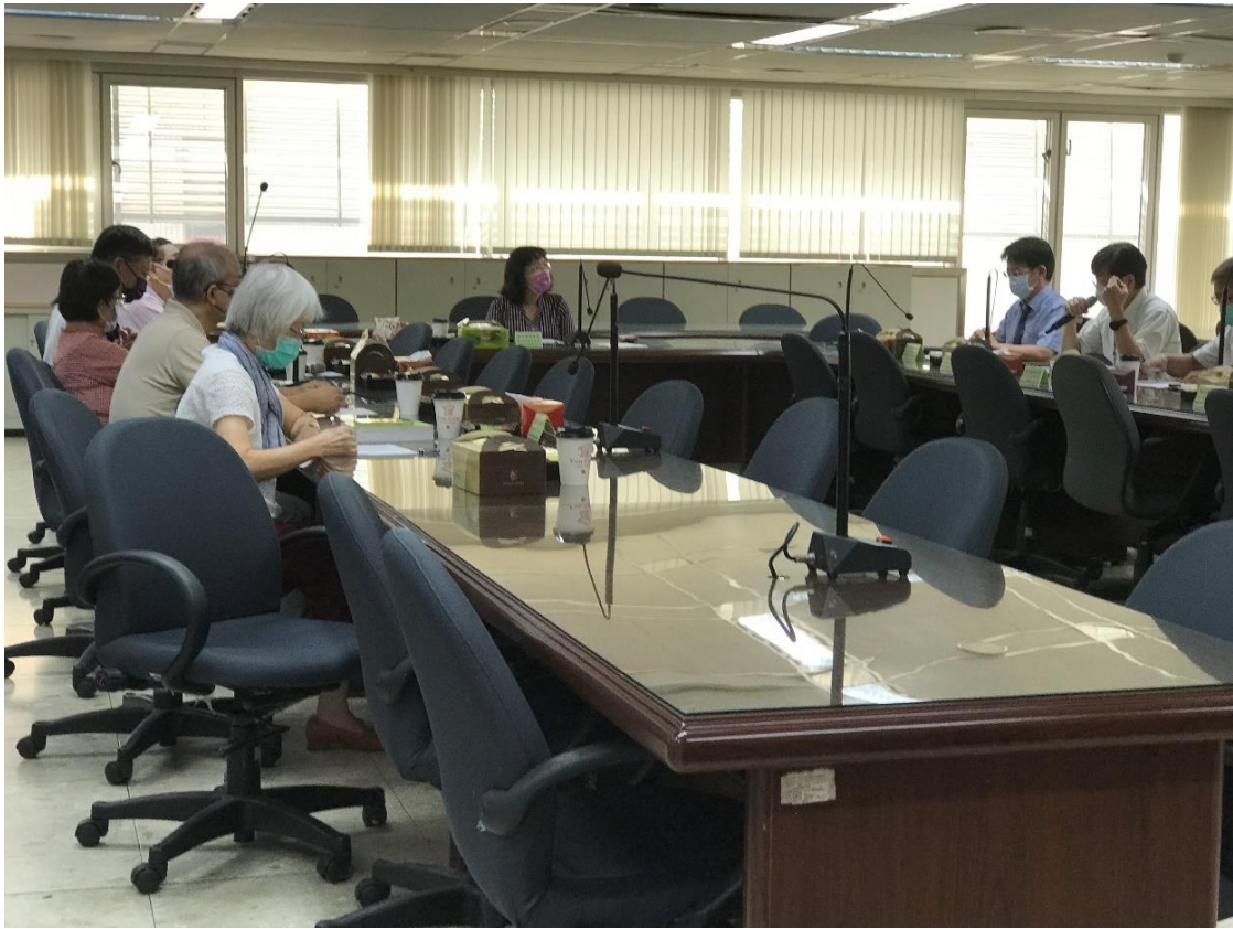
選、監、檢、警主管聯繫會報(111年11月17日)