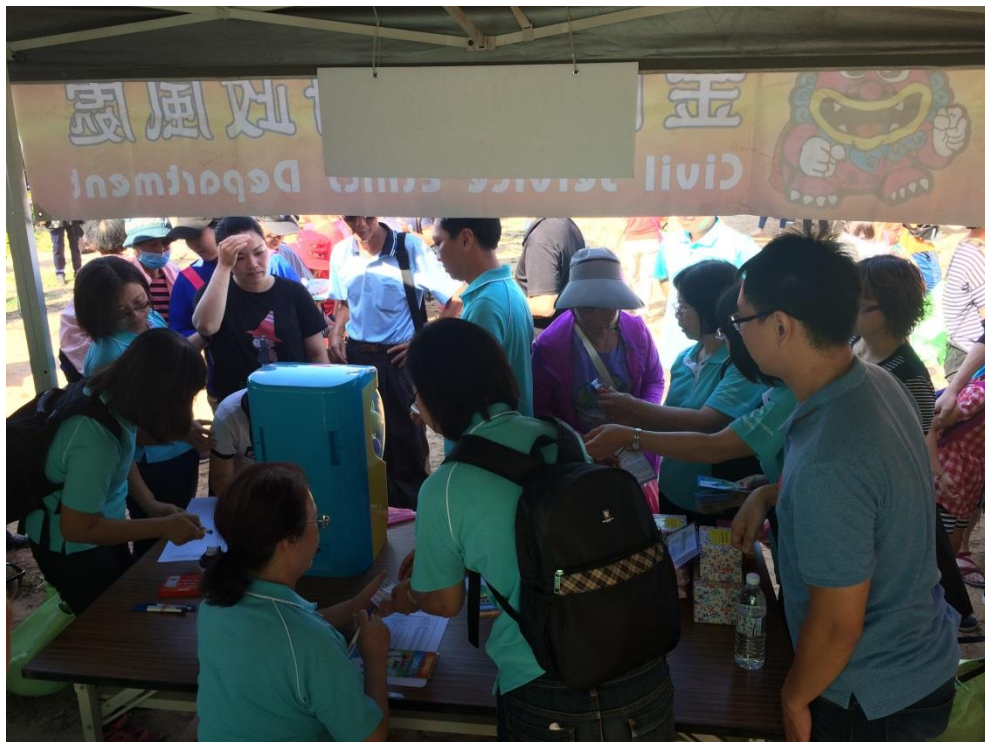
民眾於宣導攤位參與情形