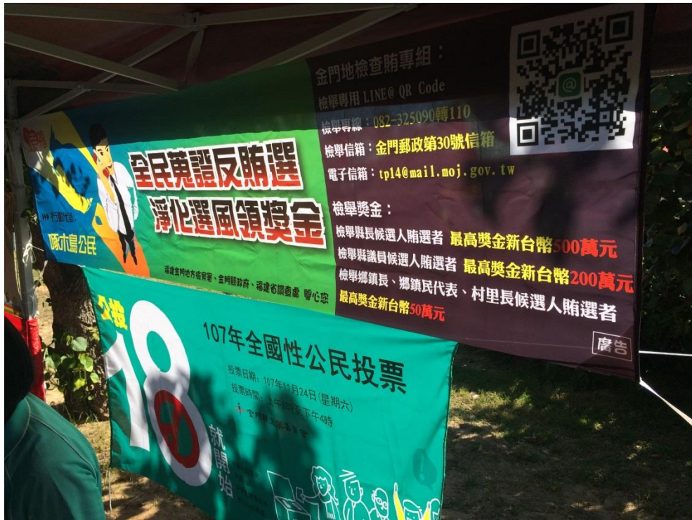
本會於活動會場設置布條宣導反賄選及公投訊息