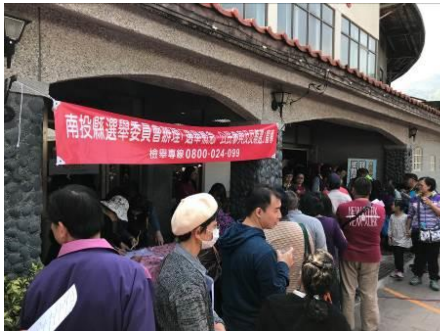
搭配「2018南投梅子節」活動進行選舉概念及反賄選教育宣導。