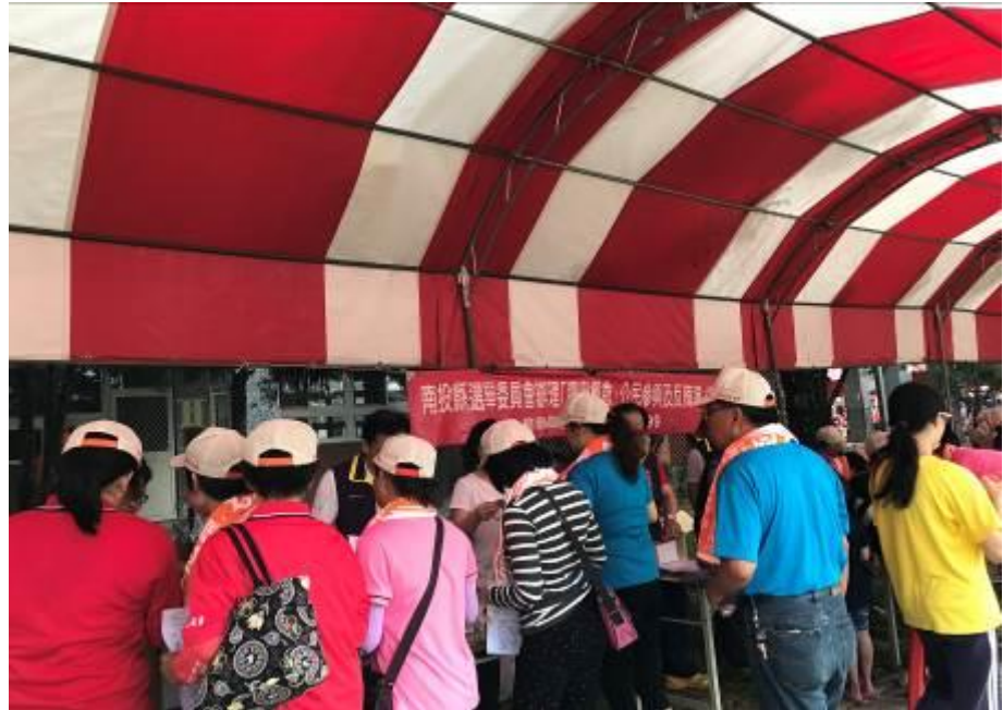
搭配「107年名間鄉運動城市嘉年華暨全鄉運動會」活動進行選舉概念及反賄選教育宣導。