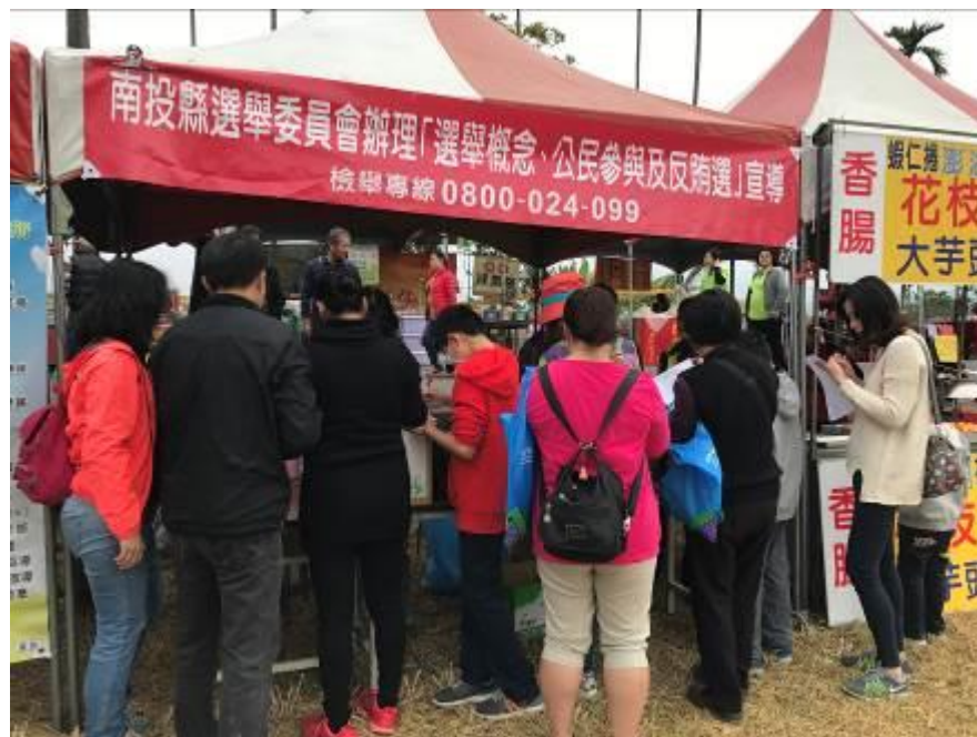
搭配「2017鹿谷田園風箏趣暨珍惜水資源活動」活動進行選舉概念及賄選教育宣導。