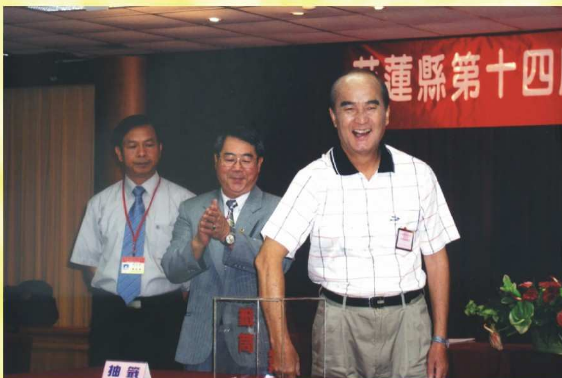
候選人號次抽籤場景（二）