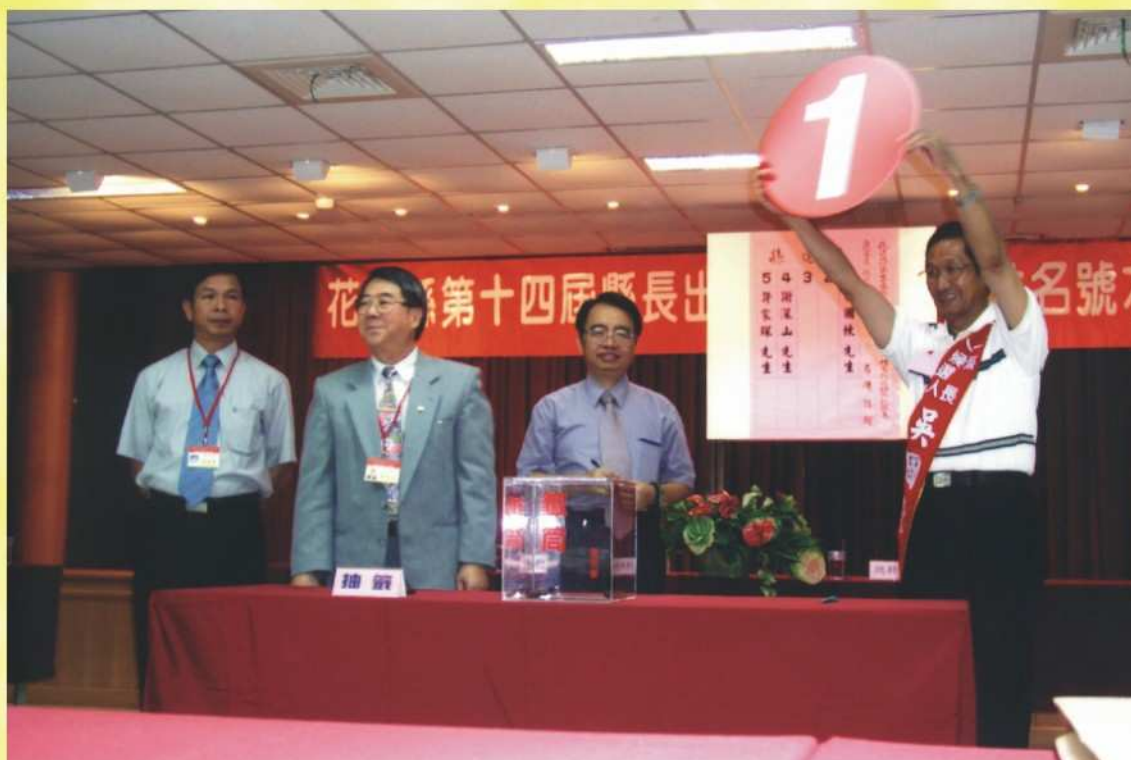
候選人號次抽籤場景（一）