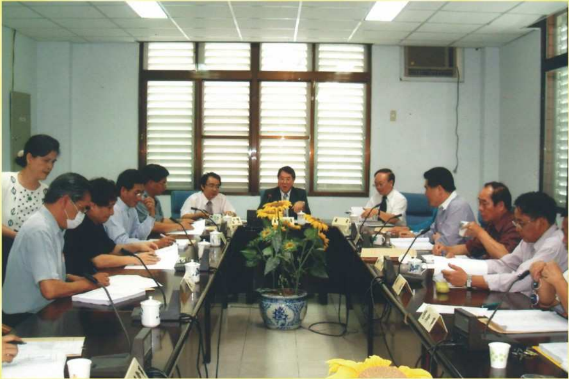
委員會議召開情形