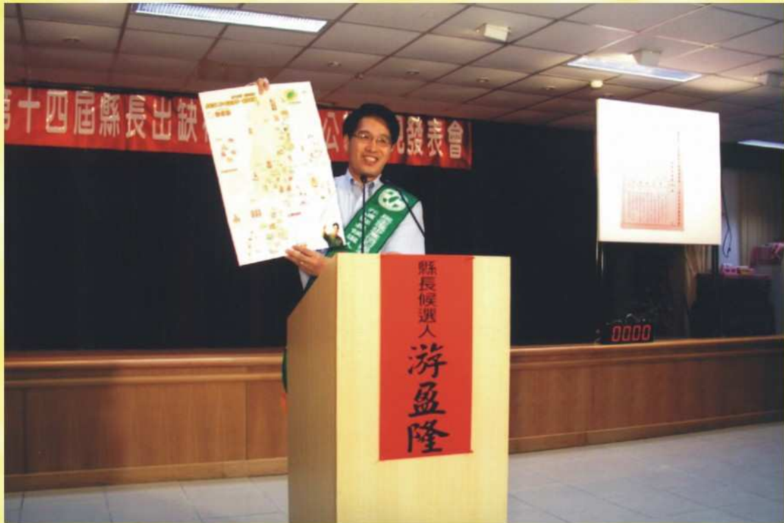
候選人公共政見發表會電視錄影場景（一）