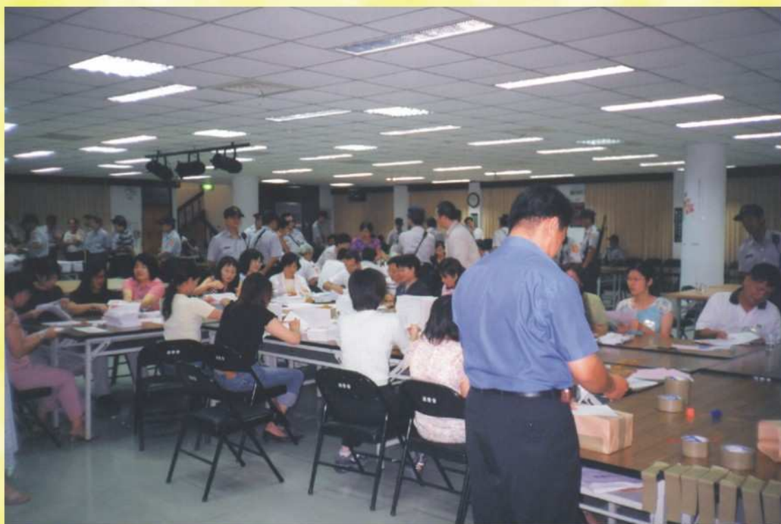
選務工作人員點領選票會場