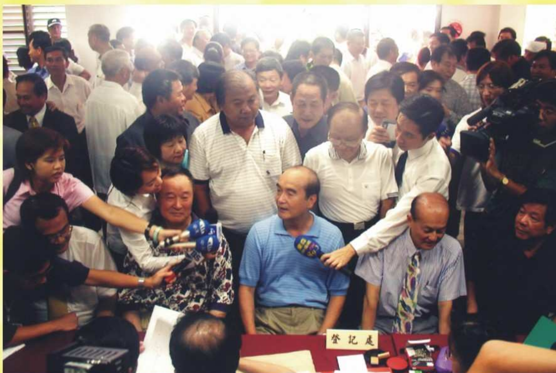
本會受理縣長候選人登記情形（一）