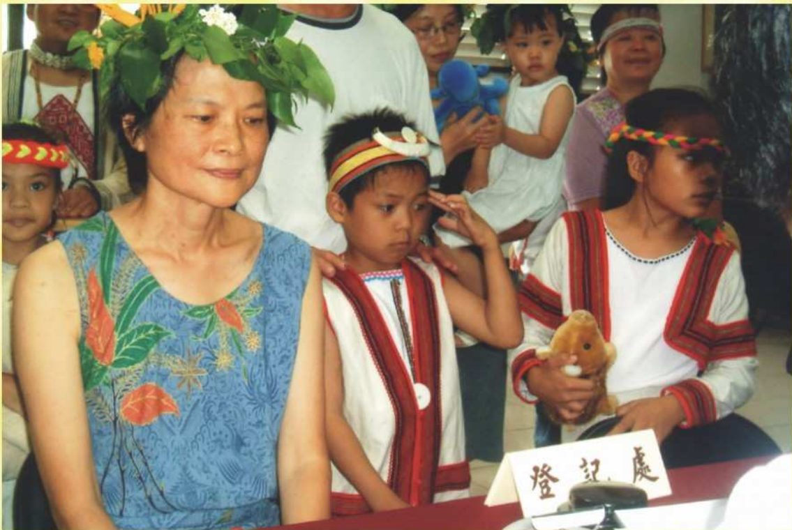
本會受理縣長候選人登記情形（四）