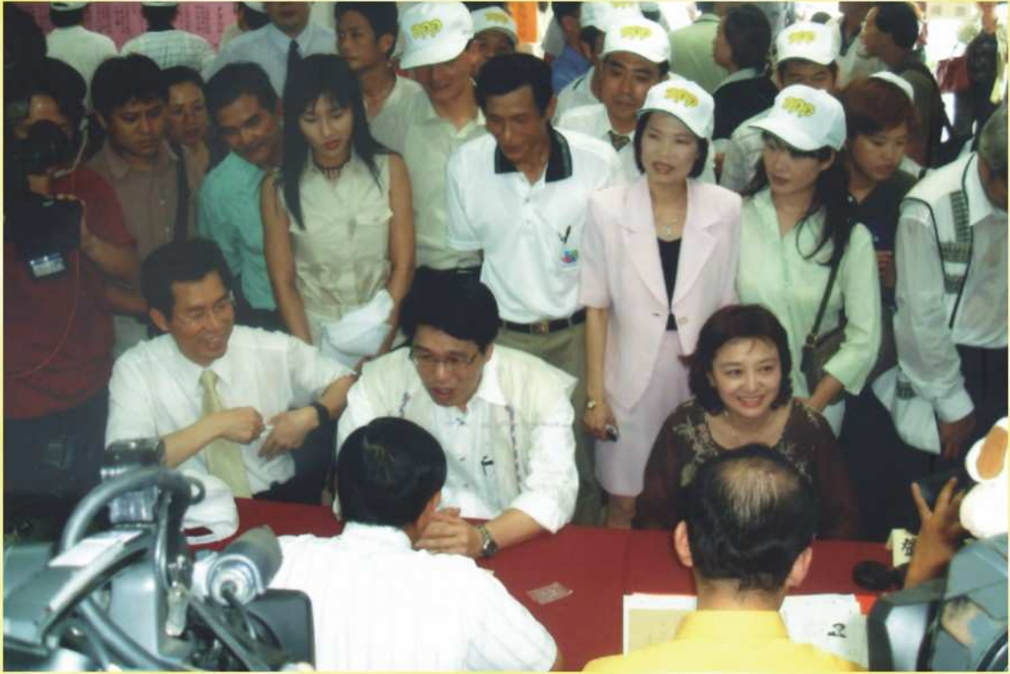
本會受理縣長候選人登記情形（三）