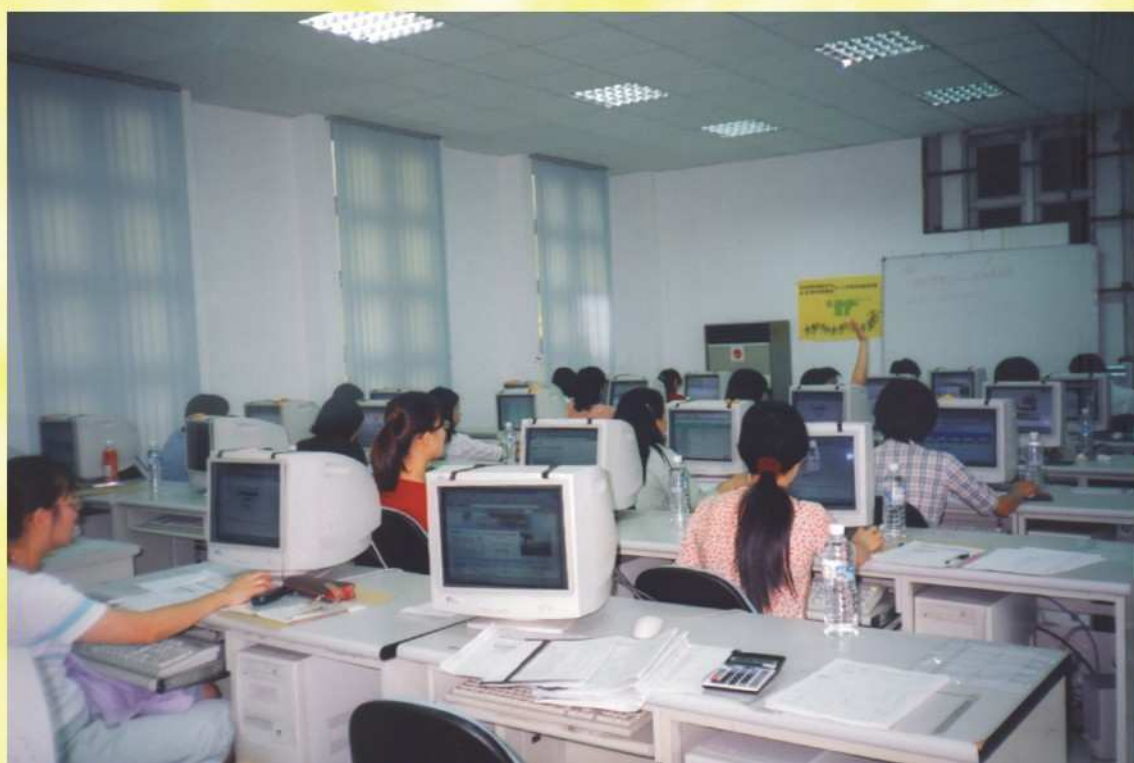
電腦記票工作人員實務演練及講習會場