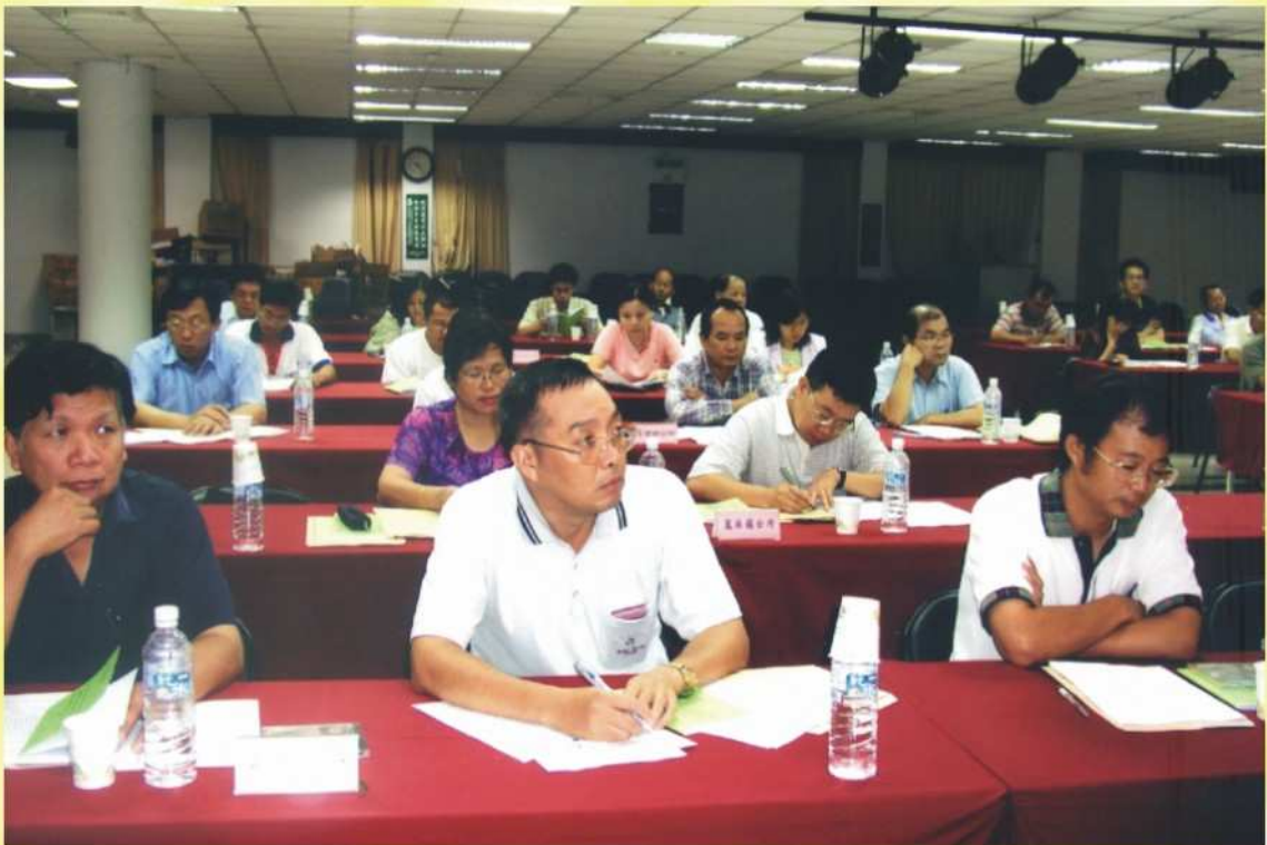
召開選務工作人員業務座談會