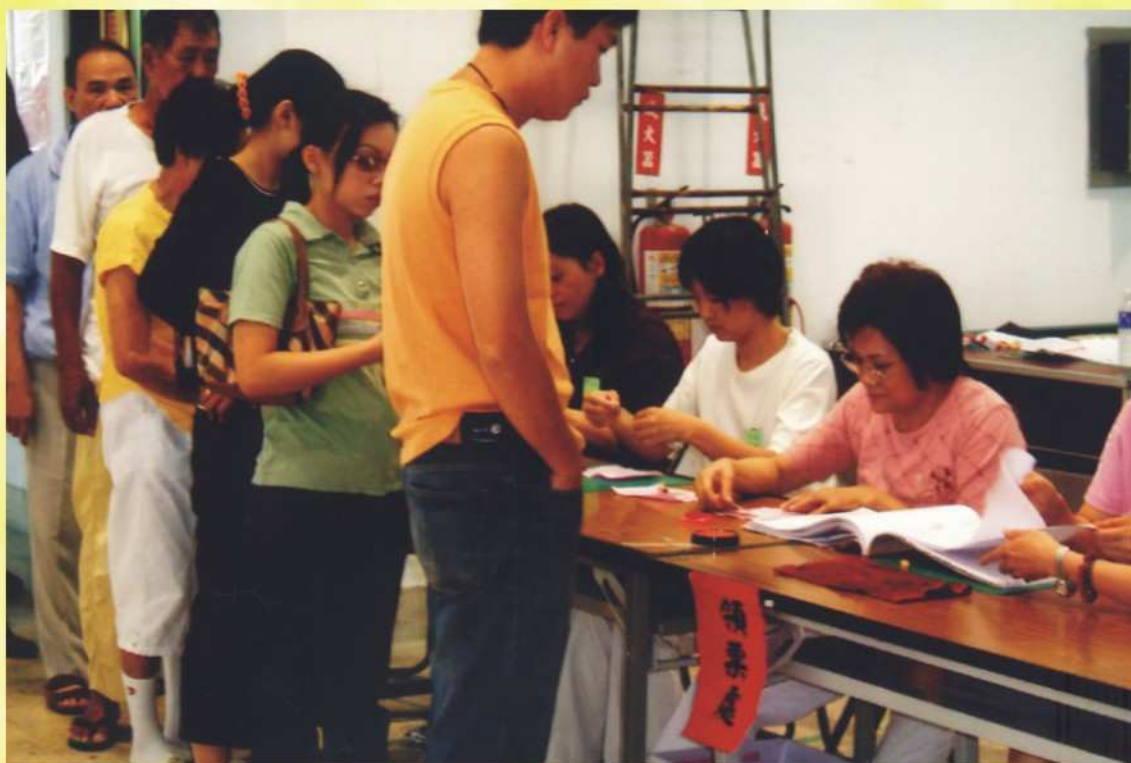
投票日投開票所投票情形