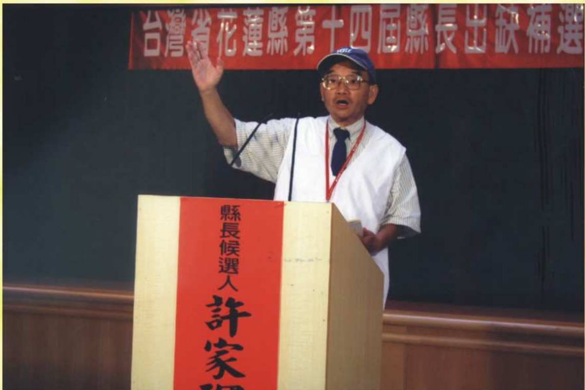
候選人公共政見發表會電視錄影場景（一）