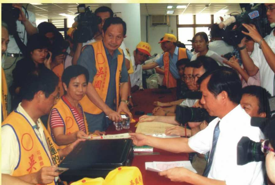
本會受理縣長候選人登記情形（二）