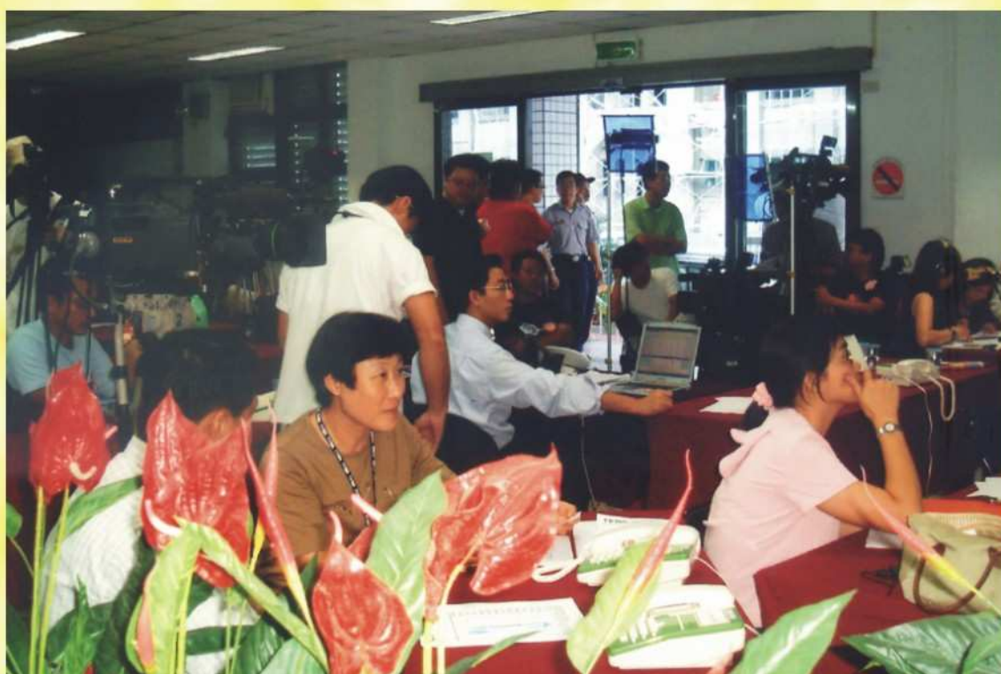
投票日本會選選情中心（各大媒體進駐）場景